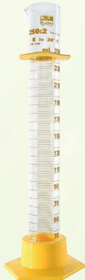
Standzylinder 250 ml